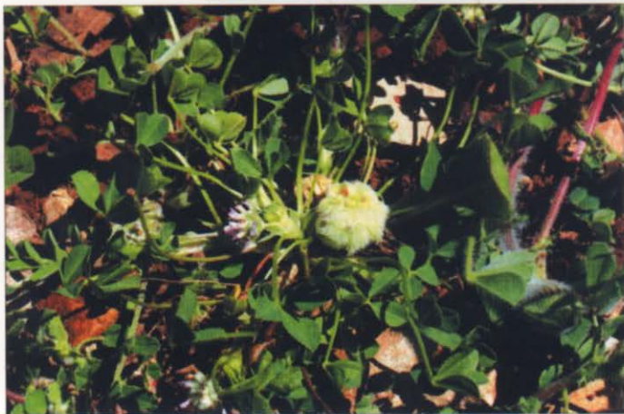
Photo 3 : Trifolium tomentosum L. Flassans-sur- Issole. De l'Aubrèguière au lac Redon. 19 avril 2004.