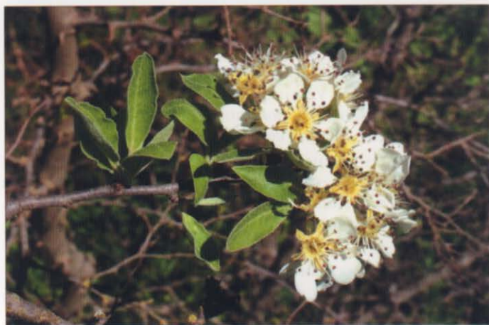
Photo 1 : Pyrus spinosa Forssk. (= P. amygdaliformis Vill.). Flassans-sur- Issole. De l'Aubrèguière au lac Redon. 19 avril 2004.